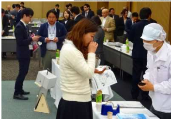
◀第2部 フリータイム