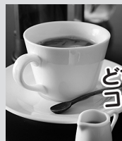
セントベリーコーヒー-38ブレンド ¥497

Cafe38では、そんなこだわりのハチミツをふんだんに使用したスイーツとこだわりのコーヒーをご用意し、喧噪を離れ、ゆるり、ふわりと和んでいただくための空間づくりを目指しています。