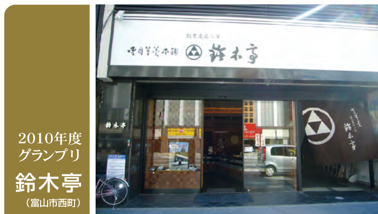
2010年度 グランプリ 鈴木亭 (富山市西町)