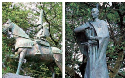
加贺藩前田家第二代藩主前田利长公像 筑城名手/信天主教的诸侯高山右近像

高冈市立博物馆 / 免费 ☎0766-20-1572 周一(要是节日就第二天)、元旦假期 JR高冈车站步行15分钟 能越自动车道高冈北出口开车10分钟