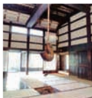
武田家住宅 / 9:00~16:30 成人210日元、初中生以下免费 周二(要是节日就第二天)、元旦假期 ☎0766-44-0724 JR雨晴车站步行20分钟 能越自动车道高冈北出口开车20分钟