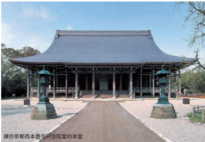
模仿京都西本愿寺阿弥陀堂的本堂