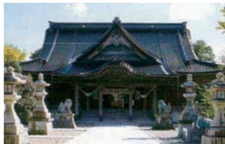
高冈关野神社 / JR高冈车站步行7分钟 能越自动车道高冈出口开车10分钟

以高冈的创建人物利长公为神灵而供奉的唯一的神社。又称高宫而受人们的亲爱。神殿里现继承保存一些江户时代修建的建筑物。