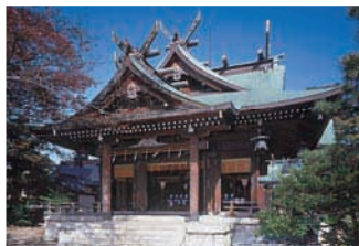
有磯正八幡宫 / ○“小径”「有磯神社前」下车1分钟 ●能越自动车道高冈出口开车10分钟

建设高冈城(庆长年间)之际,有磯宫和横田正八幡宫合祀而成的神社。于明智16年(1883)建造本殿。据说围绕院内的石墙是前田家所奉献的。墙上留有一些与高冈城一样的刻印。