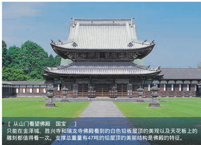
[ 从山门看望佛殿 国宝 ]

只能在金泽城、胜兴寺和瑞龙寺佛殿看到的白色铅板屋顶的美观以及天花板上雕刻都值得看一次。支撑总重量有47吨的铅屋顶的美丽结构是佛殿的特征。