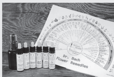
▲バッチフラワーエッセンス

全。副作用や依存性もなく、赤ちゃんからお年寄り、妊婦、病気治療中の方、ペットにも使えます。このバッチフラワーエッセンスを富山で初めて氏さんが取り扱っています。9月には商工会議所の「新商品・新サービスプレス発表会」でマスコミ記者等にプレゼンテーションされました。