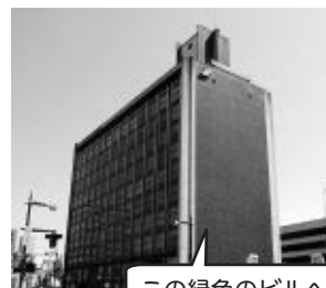
この緑色のビルへどうぞ！！