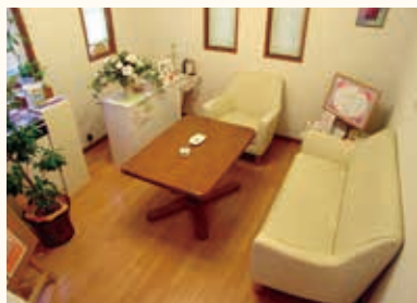
▲カウンセリングルーム

ーリングやカウンセリングのスキルを学び、メニューに取り入れていきました。「美を追求していくと健康へ、健康を追求すると心の元気へ、そして目に見えないエネルギーの重要性を感じるようになりました」