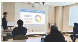
セミナーを随時開催しています

求人採用は求人業者に依存せず、自社で仕組みを作れる時代です。インターネットを活用した低予算でできる「勝手に応募が集まる仕組み」をご提案します。